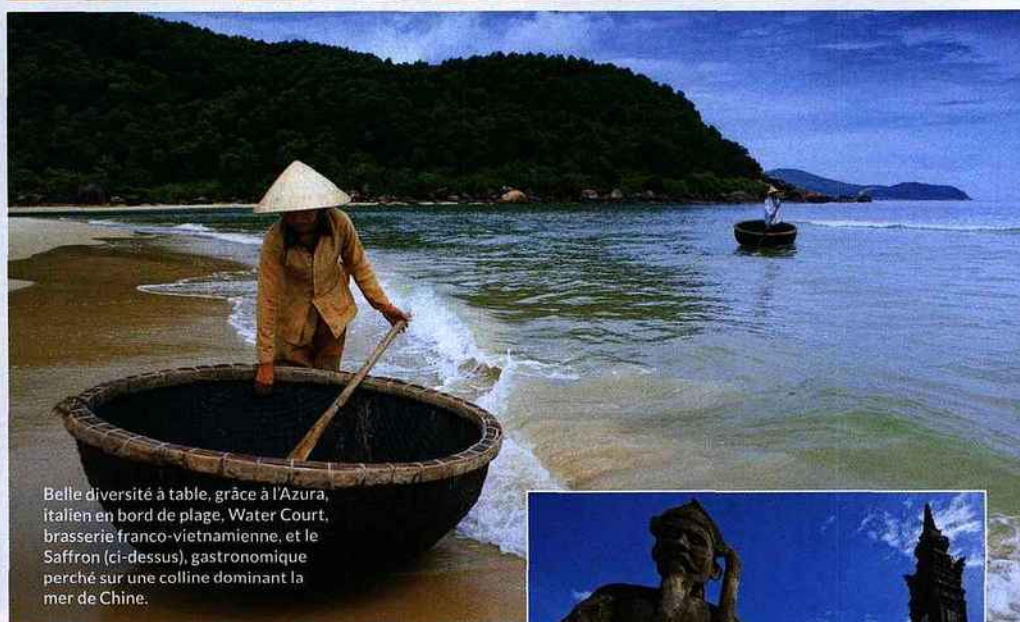
Belle diversité à table, grâce à l'Azura, italien en bord de plage, Water Court, brasserie franco-vietnamienne, et le Saffron (ci-dessus), gastronomique perché sur une colline dominant la mer de Chine.