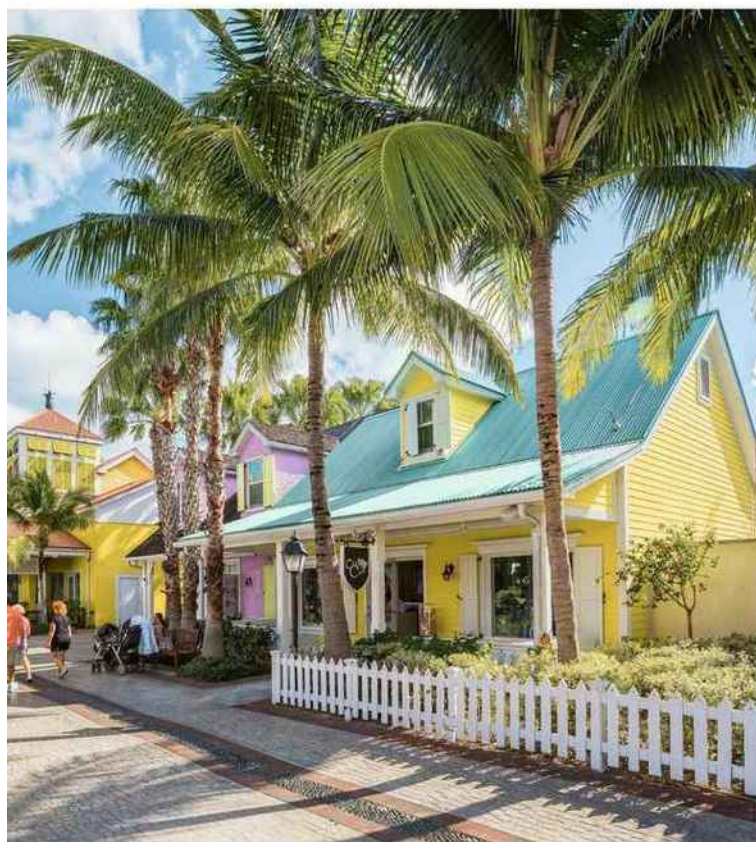
PARADISE ISLAND CONCENTRE HÔTELS, PLAGES ET CASINOS.